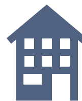
Pisos Trep 3 pisos